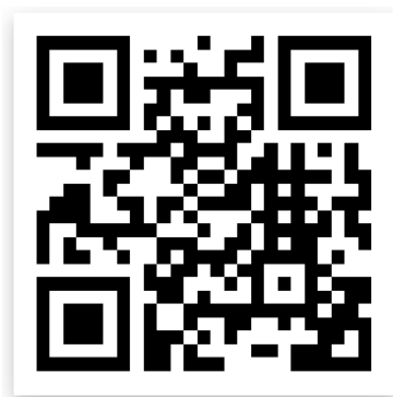
ภาพภาคผนวกที่ 2 แหล่งเรียนรู้วัฒนธรรมทางการเกษตรออนไลน์ http://agriculture.pbru.ac.th และเว็บไซต์รวบรวมผลงาน www.thaiseasalt.info