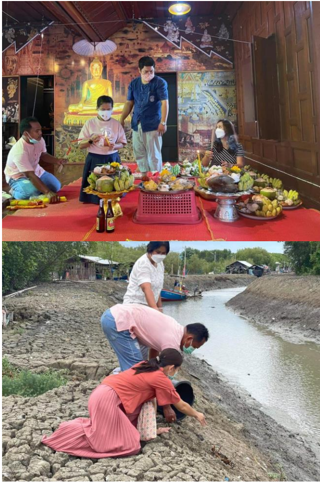
ภาพภาคผนวกที่ 1 การยกระดับภูมิปัญญางานปีผีเสื้อและการบูรณาการจัดการทรัพยากรชายฝั่งระหว่างเครือข่ายความร่วมมือภายในและภายนอก