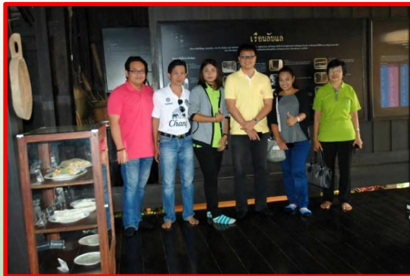
พิพิธภัณฑ์ท้องถิ่นเมืองลับแล

ข้อเสนอแนะจากคณะศึกษาดูงาน ระหว่างวันที่ 23-27 กุมภาพันธ์ 2558