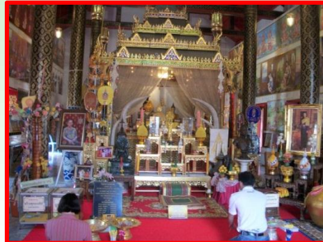
วัดพระแท่นศิลาอาสน์