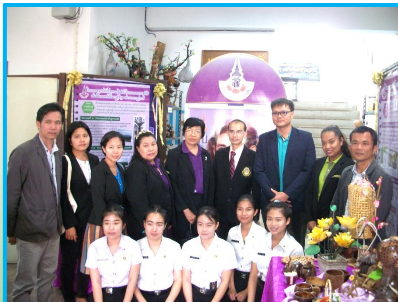
คณะทำงานโครงการอนุรักษ์พันธุกรรมพืชอันเนื่องมาจากพระราชดำริฯ มหาวิทยาลัยราชภัฏเพชรบุรี ชม นิทรรศการและผลงานของโครงการสวนพฤกษศาสตร์โรงเรียน มหาวิทยาลัยราชภัฏอุตรดิตถ์