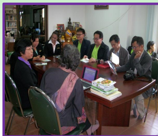
ภาพบรรยากาศในการศึกษาดูงานที่สถาบัน ความหลากหลายทางชีวภาพฯ มหาวิทยาลัยราชภัฏเชียงราย